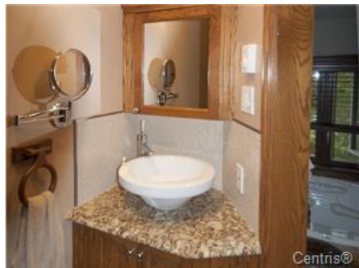
Salle de bains attenante à la CCP