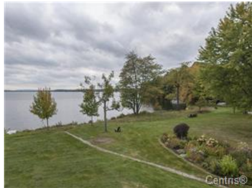
Vue sur l'eau