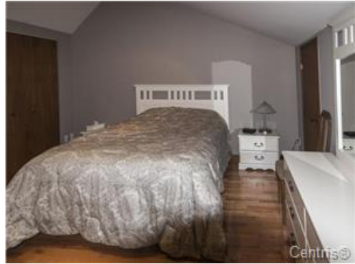
Chambre à coucher principale