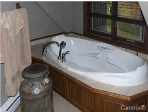
Salle de bains attenante à la CCP