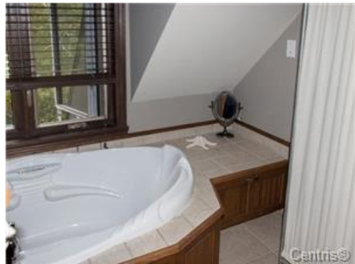
Salle de bains attenante à la CCP