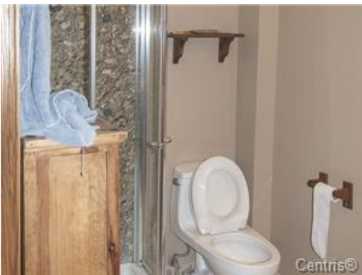
Salle de bains attenante à la CCP