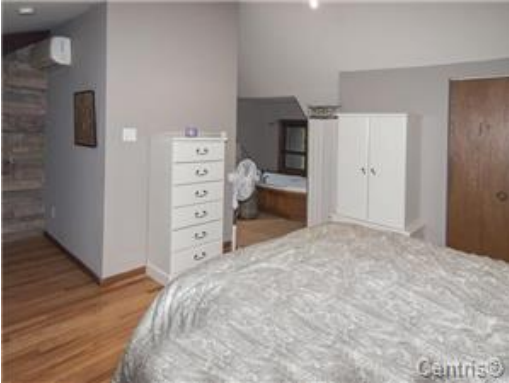
Chambre à coucher principale